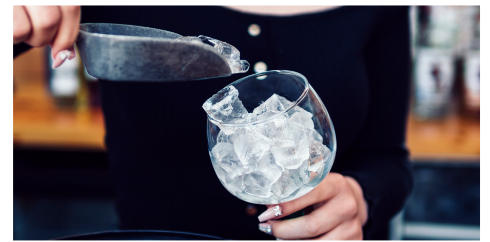
Melhora a qualidade do gelo

Auxilia na proteção do equipamento contra o acúmulo de incrustações contribuindo para uma operação mais estável.