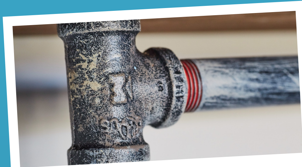
Reduz os efeitos do calcário