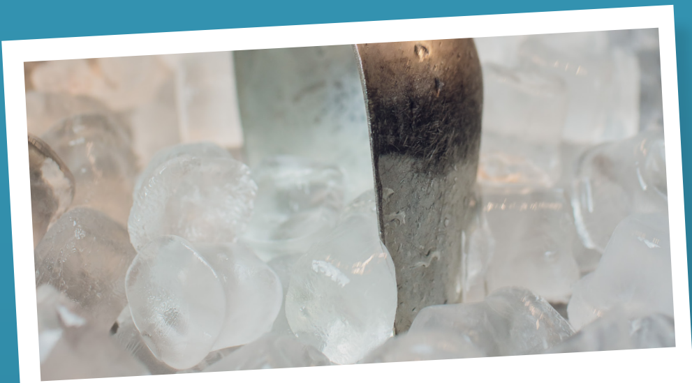
Reduz o cloro presente na água