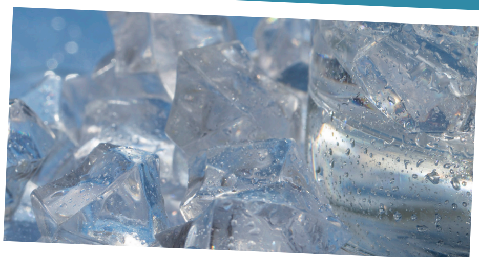
Gelo mais claro e sem odores

Melhora a qualidade da água utilizada na máquina, ajudando a reduzir o cloro, clarear o gelo e minimizar gostos que podem interferir.