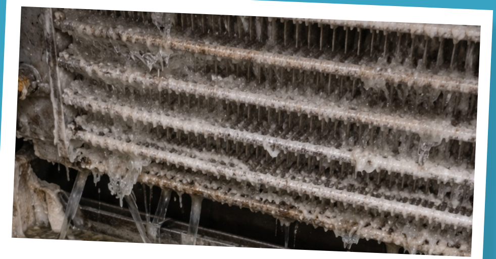
Protege componente internos