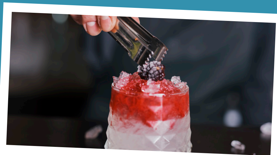
Preserva o sabor da utilização final