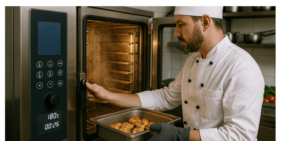
Reduz paradas recorrentes

A água influencia diretamente a conservação, o desempenho e a aparência do forno combinado.