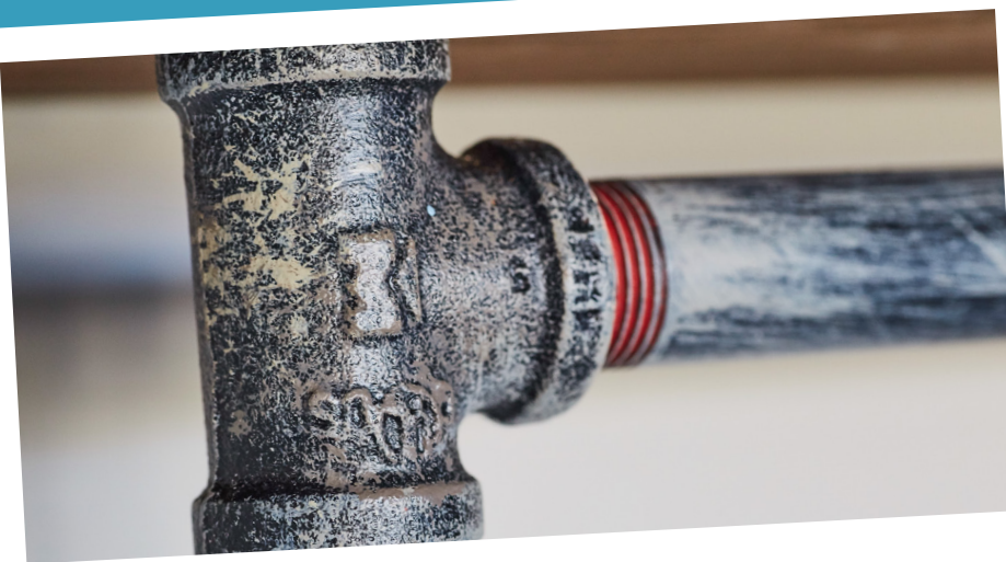
Reduz os efeitos do calcário