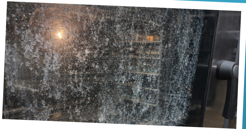
Protege vidros e componente internos