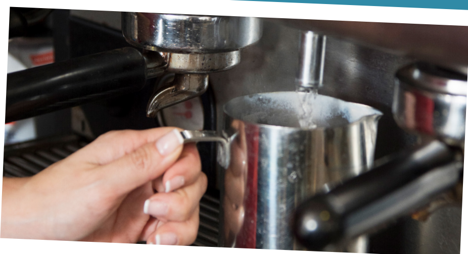
Água mais clara e sem odores

Melhora a qualidade da água utilizada na máquina, ajudando a reduzir o cloro, clarear a água e minimizar gostos que podem interferir no sabor final do café.