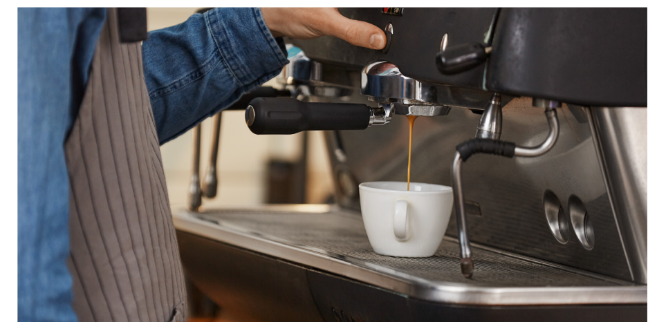
Reduz paradas recorrentes

Auxilia na proteção do equipamento contra o acúmulo de incrustações contribuindo para uma operação mais estável.