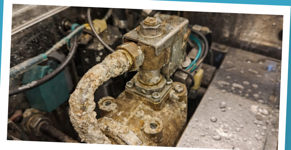
Protege componente internos

Auxilia na proteção do equipamento contra o acúmulo de incrustações contribuindo para uma operação mais estável.