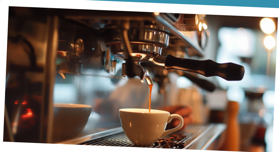
Preserva o sabor final do café