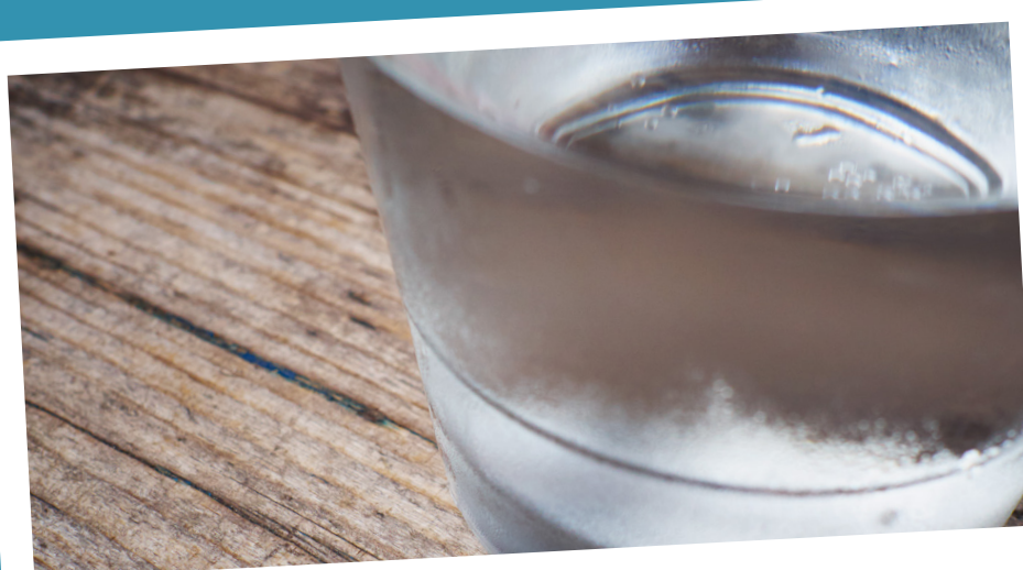
Reduz o cloro presente na água